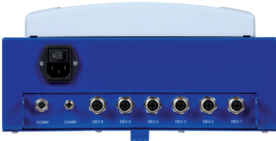
Aansluiting voor 6 apparaten