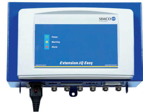
Makkelijke kabel toegang